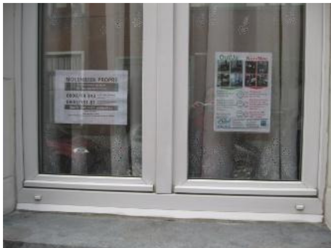
Affiches voor de ramen in de Courtoisstraat