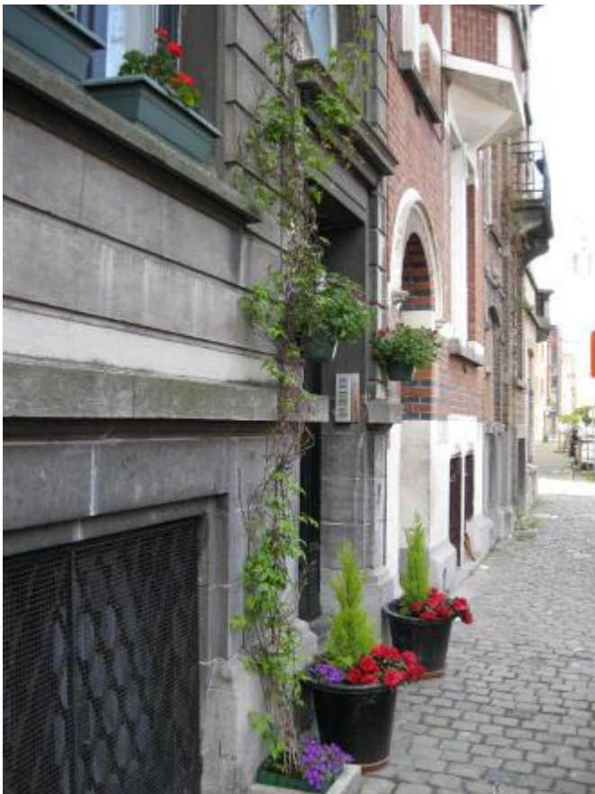
Bloempotten voor de deur in de Courtoisstraat

Neen, we hopen met een buurtcomité te kunnen starten en we hebben een tweede project ingediend in het kader van het wijkcontract Leopold II dat ook de wijk Werkhuizen-Mommaerts omvat. We hebben al drie nieuwe bewoners gevonden die dit project mee onderschreven hebben, want meer en meer mensen geraken gemotiveerd om mee te doen.