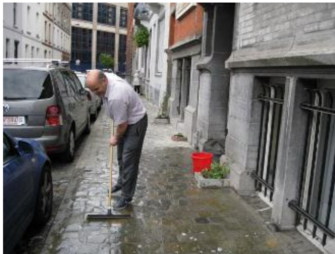
Een bewoner uit de Courtoisstraat kuist zijn stoep

een klimplant geplant. Buurthuis Bonnevie verkocht ze en legde ons uit hoe we ze moeten verzorgen. Ik hoop met dit initiatief de buurt aangenamer en gezonder te maken, en ik hoop dat er een positieve dynamiek groeit tussen de bewoners.