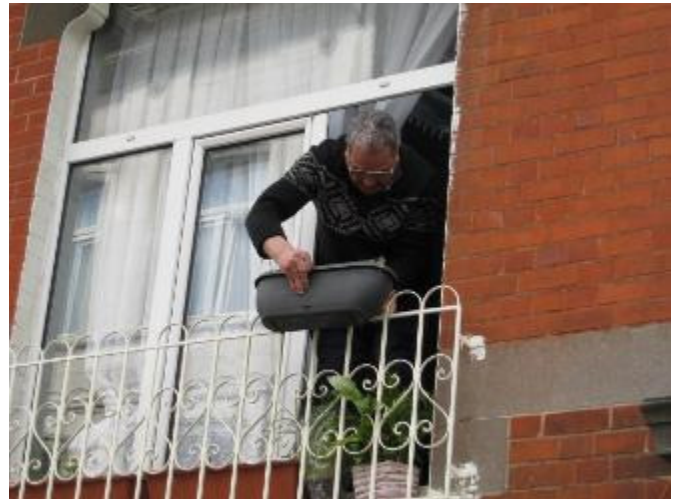
Een inwoner hangt een bloemenbak aan zijn balkon