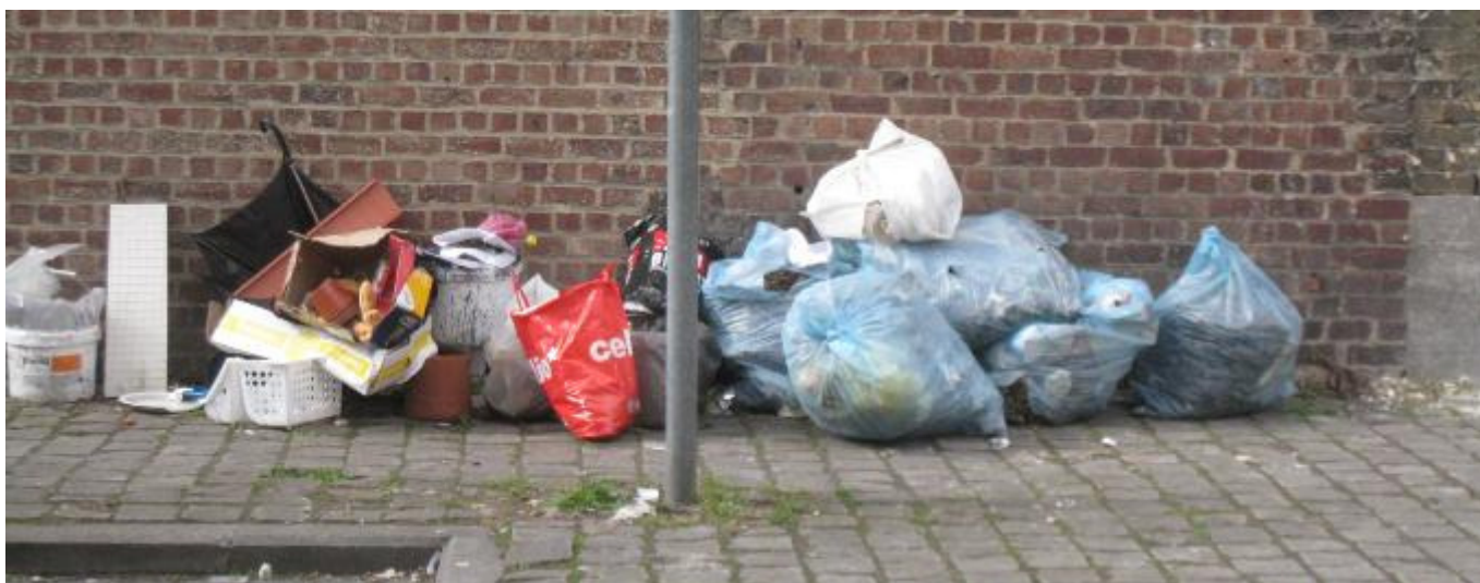
Sluikstorten in de Courtoisstraat

In buurthuis Bonnevie hing er een affiche ‘ Want het kan anders in mijn buurt ’ van het Alain de Pauw Fonds. Ze lanceerden een oproep voor mannen of vrouwen met een sociaal engagement, die in 2012 een project rond natuur, milieu en respect voor de leefomgeving willen opzetten om het leven in hun Brusselse Buurt te verbeteren: een project rond het herwaarderen of in gebruik nemen van groene ruimtes in de stad, het aanleggen van openbare stadstuinjes, een educatief project rond milieu, natuur, afval, of water... Het gaat over individuele initiatieven en niet om projecten van verenigingen.